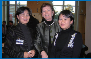
유엔회의에서 만난 아일랜드 7대 대통령 메리 로빈슨(가운데)