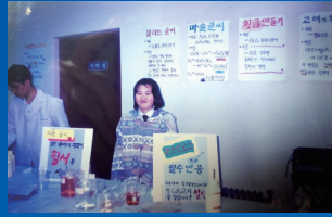
경기 과학고 학생시절