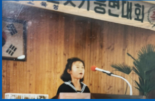
연천에서 살던 어린시절