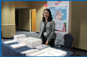
SK텔레콤 CSR 매니저 업무

“기업의 환경친화적 경영 실현을 유인하기 위해선 외부의 목소리가 높아져야 됩니다”