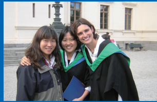
스웨덴 룬드대학 환경 경영·정책학 석사시절