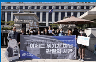
청소년기후소송에 대한 기자회견

“세계 각국은 기후위기 대응을 최우선 과제로 삼고 ‘탄소중립’을 향해 달려가고 있습니다”