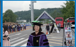
서울대 법학박사 졸업