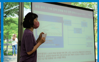
기후환경 단체 <플랜1.5> 활동