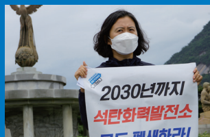
2030년 탄소중립 계획 수립 및 신규 석탄발전소 건설 중단 요구 기자회견