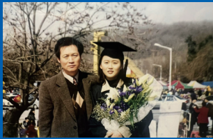
서울대 공학사·경영학사 학창시절

“기후환경 위기 해결을 위해서는 경제 체질 개선이 중요하다는 것을 깨달았습니다”