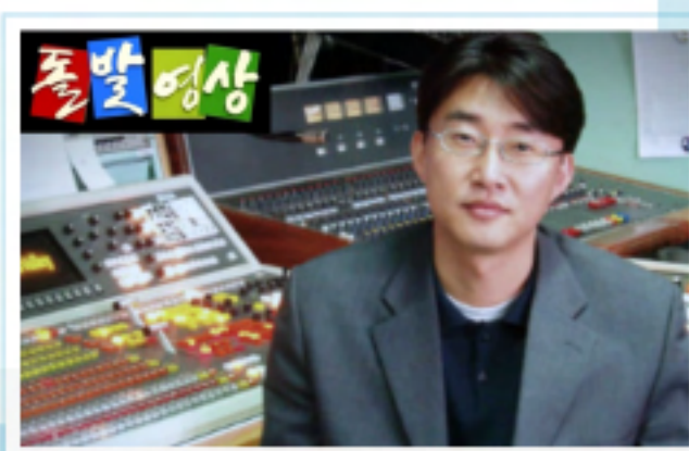
뉴스의 혁신 돌발영상 최초 기획·제작