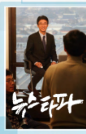
가짜뉴스 타파 뉴스타파 창립·초대 앵커