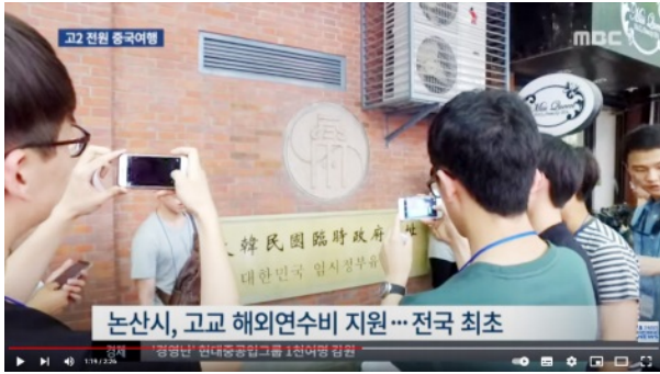
청소년 글로벌 인재 해외연수