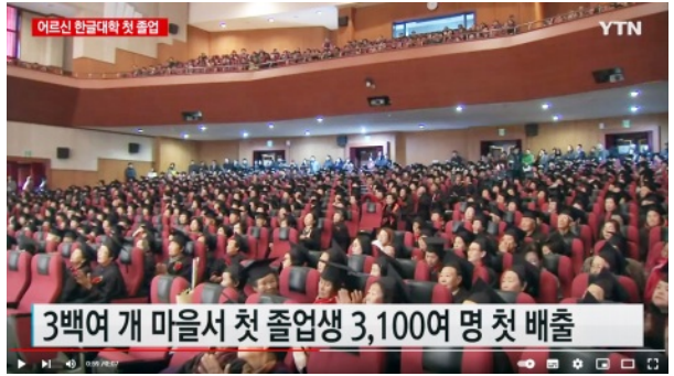
마을로 찾아가는 어르신 한글대학