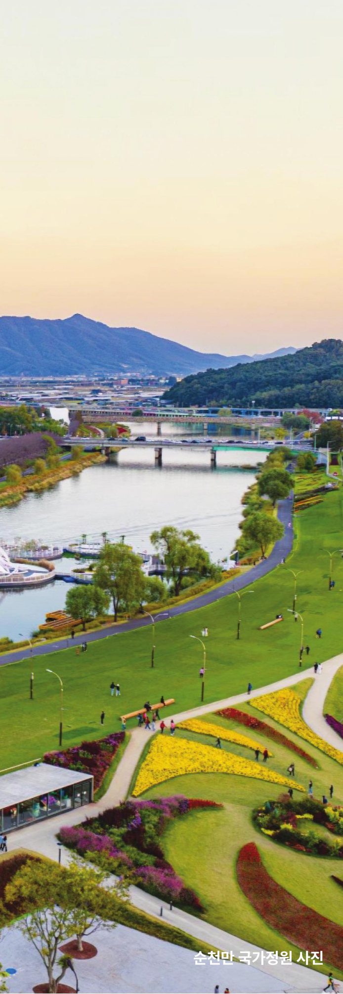
순천만 국가정원 사진