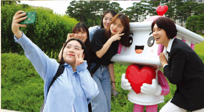
교통안전공단 어린이 통학로 점검 설명회