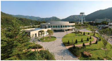
기적의 도서관 건립