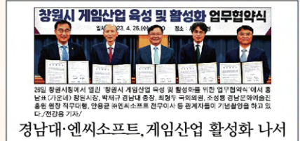
경남대·엔씨소프트, 게임산업 활성화 나서

연제대 이어 정부 공모 선정 교육청 개발 및 지역사회문제 해결 연간 20억 원·최장 8년 지원 행 교과목 도입이다. 지역 제조업 도와 협력해 100만 인제 양성 디지털 전환을 주도할 실무형 소프 트웨어 핵심 인재 육성이 목표다.