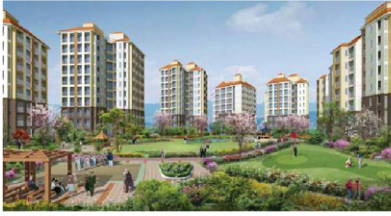
시니어 헬스케어타운 조성