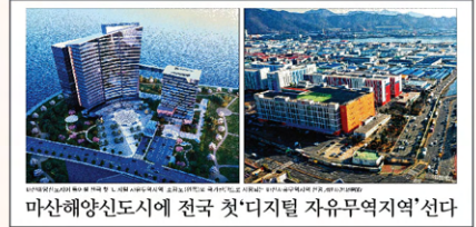
마산해양신도시에 전국 첫 '디지털 자유무역지역' 선다