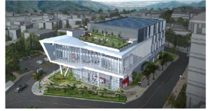
3세대행복 체육센터 건립