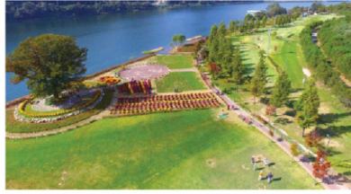
3대 함께 즐기는 파크골프장