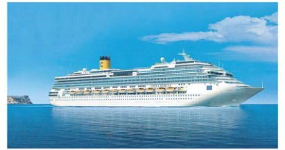
남해안 국제크루즈 취항