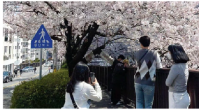
아름다운 도심천(川)길 조성