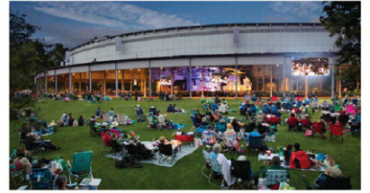
해양신도시 해양 뮤직 페스티벌