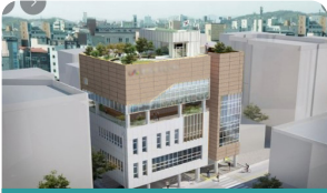
고덕2동 주민센터 신축 추진