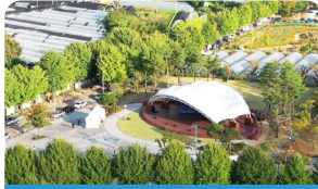
역사문화공원 내 문화전시장 마련