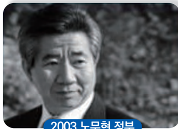
2003 노무현 정부