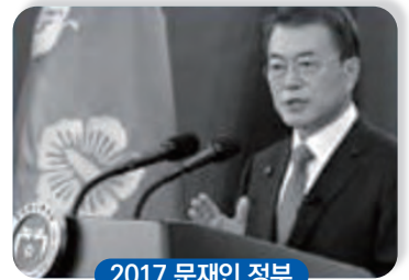
2017 문재인 정부