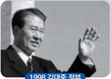
1998 김대중 정부