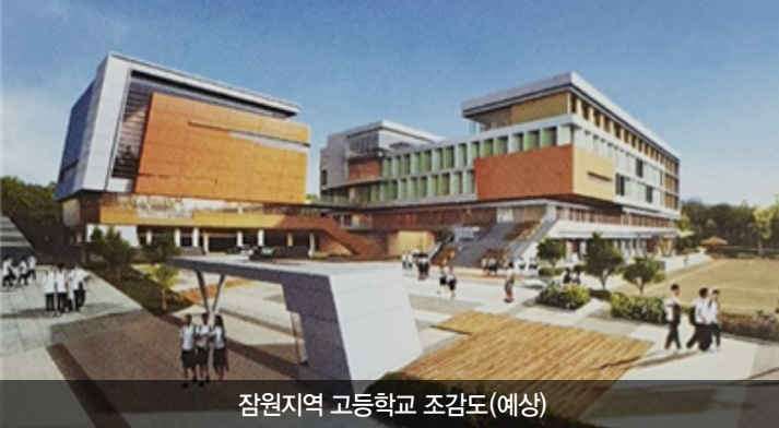
잠원지역 고등학교 조감도(예상)