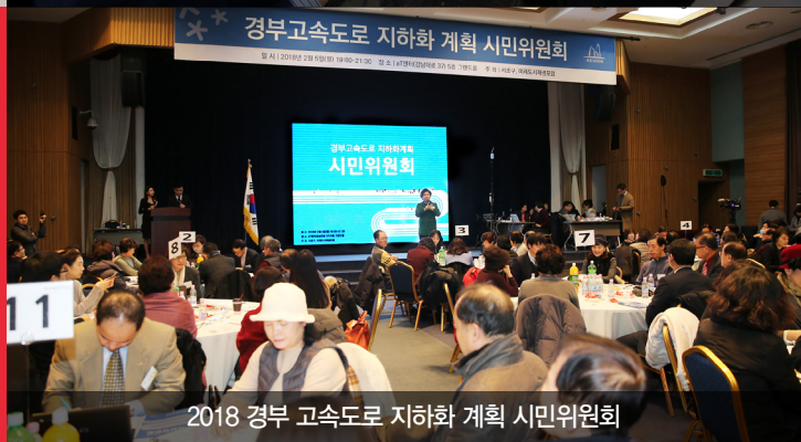
2018 경부 고속도로 지하화 계획 시민위원회

9년 전 조은희가 처음 제안하고, 서초구민과 함께 해온 경부고속도로 지하화! 서울시가 지난해 4월 연구용역에 착수했습니다. 시작도 마무리도 조은희가 제대로 해내겠습니다.