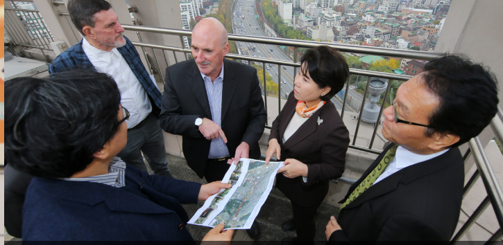
2016 양재-한남 경부 고속도로 지하화 국제컨퍼런스