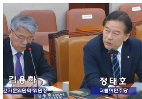
국회 연금개혁특별위원회 위원(현)