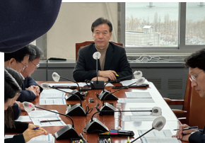
국회 기획재정위원회 예산결산기금심사소위원장(현)