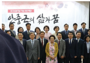
안중근 의사 유해 발굴·봉환 국회의원 모임(현)