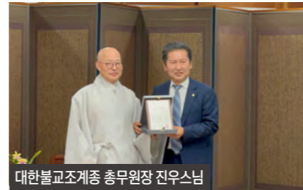
대한불교조계종 총무원장 진우스님