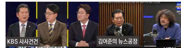
KBS 시사건전 김어준의 뉴스공장 MBN