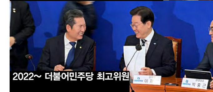
2022~ 더불어민주당 최고위원