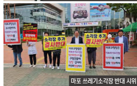
마포 쓰레기소각장 반대 시위