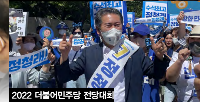
2022 더불어민주당 전당대회