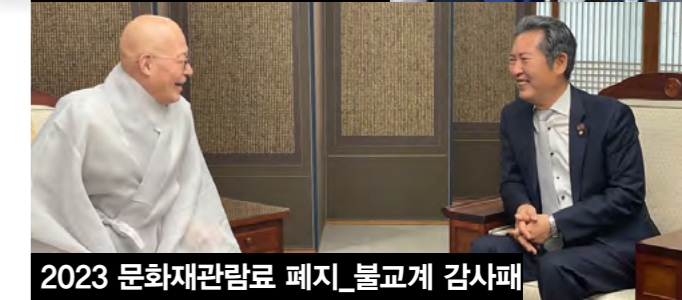
2023 문화재관람료 폐지_불교계 감사패