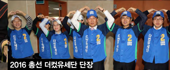
2016 총선 더컷유세단 단장