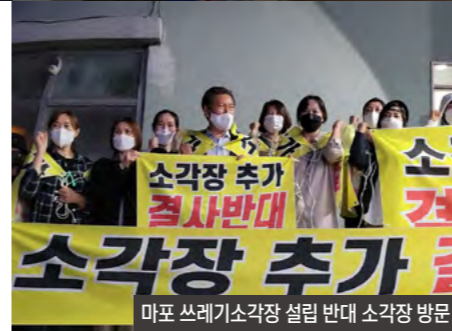
마포 쓰레기소각장 설립 반대 소각장 방문

24.03 신규 쓰레기소각장 환경영향평가 협의회 구성 반대의 건 공문발송 / 환경부