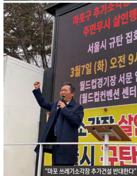
"마포 쓰레기소각장 추가건설 반대한다"