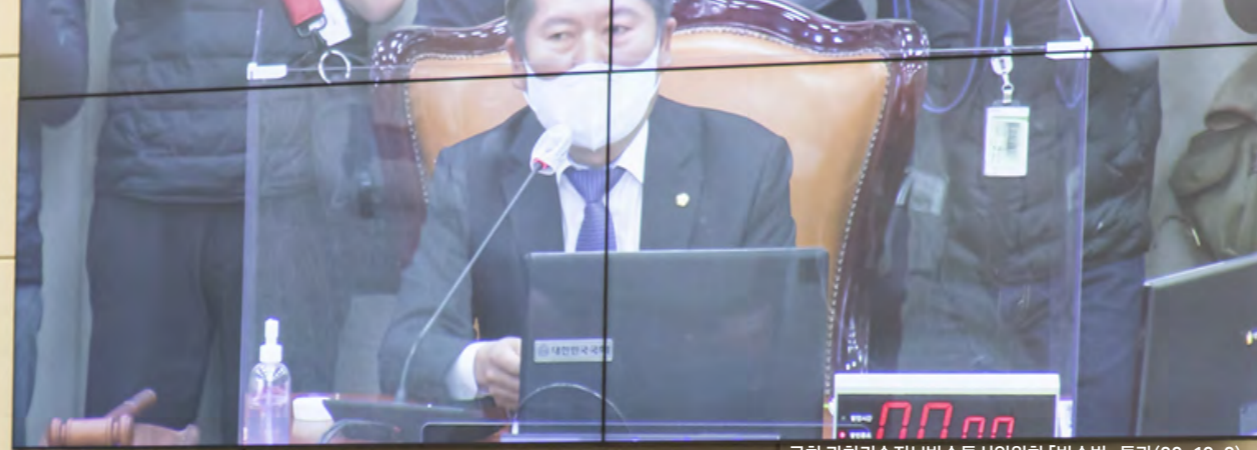
국회 과학기술정보방송통신위원회 「방송법」 통과(22. 12. 2)