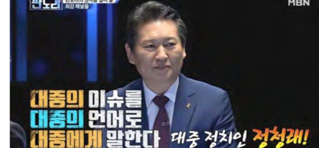
대중의 미움을 대중의 언어로 대중에게 말한다 대중 정치인 정청래!