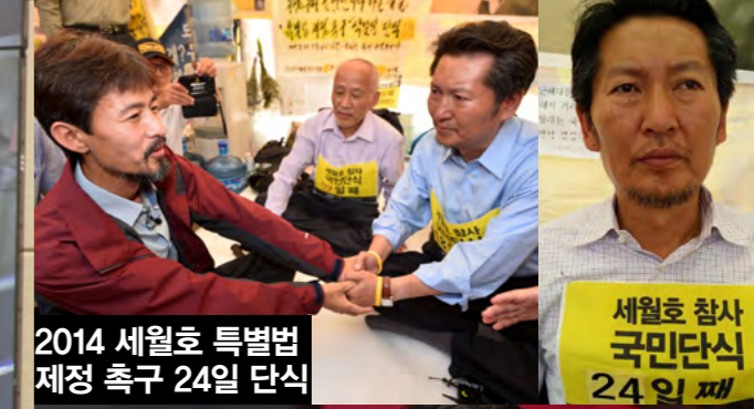
2014 세월호 특별법 제정 촉구 24일 단식