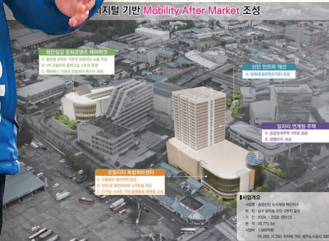
디지털 기반 Mobility After Market 조성

3 송암산단 혁신지구(총사업비 1,560억원)는 기존의 모빌리티 정비 자원과 광주시의 미래차 관련 시설 등 인프라를 활용한 관련 애프터마켓(After Market) 산업과 인력 육성 등 복합 산업 지구로 조성하겠습니다.