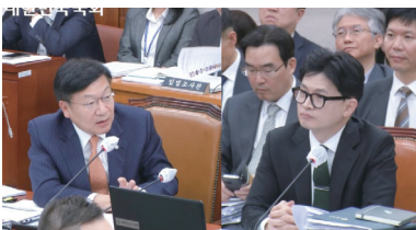
법사위 질의(한동훈 법무부장관 대상)