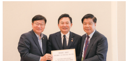
원희룡 국토부장관 면담 및 건의(2023.6.30.)