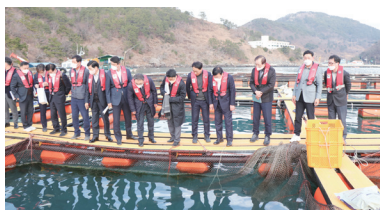
통영 지역 현장시찰(조승환 해수부장관 동행)