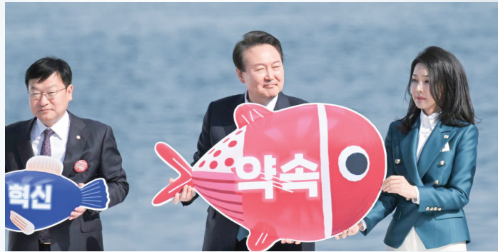
2023.3.31. 수산인의 날(통영) 윤석열 대통령 내외 참석

윤석열 정부의 성공을 통한 대한민국의 힘찬 도약을 뒷받침하겠습니다. 집권 여당의 힘으로 통영시와 고성군의 발전을 도모하겠습니다.