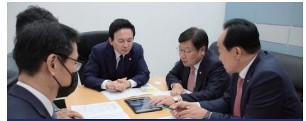
원희룡 국토부장관 면담 및 건의(2022.11.10.)