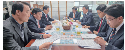
환경부·해수부·지역구 국회의원 간담회 (2023.2.8.)