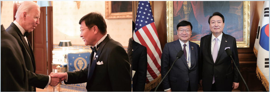
2023.4.24.~4.30. 미국 국빈 방문 동행