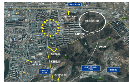
원오송로 개통 조감도