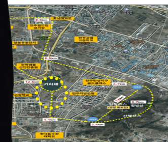
황방산 명품 둘레길