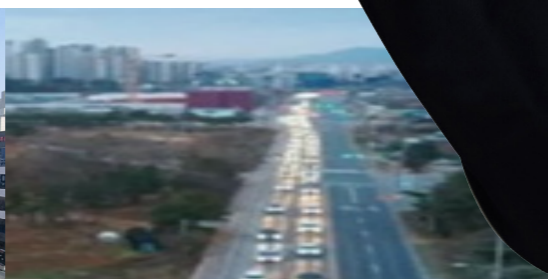
북부권 교통난 광경