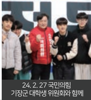
24. 2. 27 국민의힘 기장군 대학생 위원회와 함께

기장군 청년 여러분! 생애 첫 투표를 응원합니다! 내일을 위한 가치 있는 한 표! 기장의 밝은 미래, 여러분의 손으로 만들어 나갑니다!