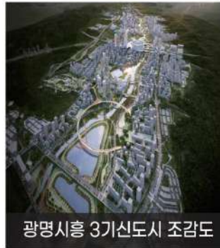
광명시흥 3기신도시 조감도