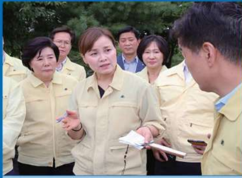
목감천 저류지 조성 현장간담회