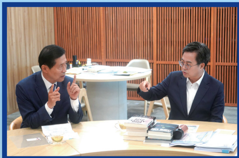
김동연 경기도지사 만나 군포 교통대책 논의