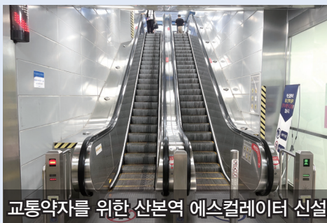
교통약자를 위한 산본역 에스컬레이터 신설