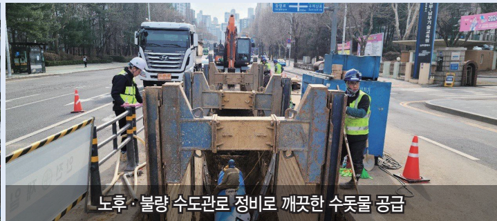
노후·불량 수도관로 정비로 깨끗한 수도물 공급