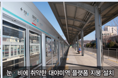
눈·비에 취약한 대야미역 플랫폼 지붕 설치