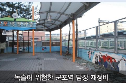
녹슬어 위험한 군포역 담장 재정비

금정역 급행전철 정차, 산본역 에스컬레이터 설치 등 교통환경을 개선했습니다.