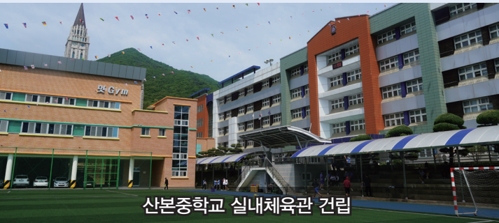
산본중학교 실내체육관 건립