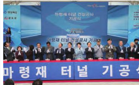
· 마령재 터널 기공식