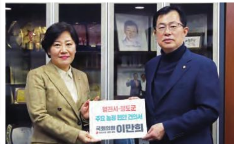
· 송미령 농림부장관과 지역 주요현안 논의