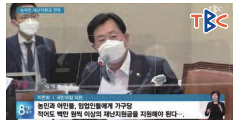
▲ 농업인 재난지원금 지급 주장