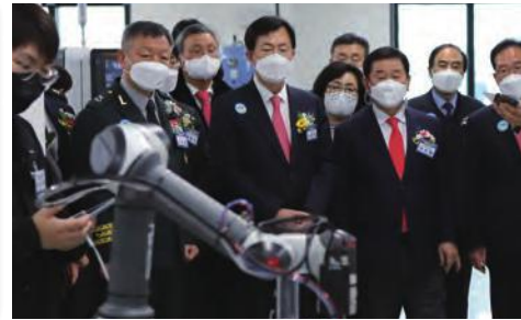
· 한국폴리텍대학 영천 로봇캠퍼스 개교식