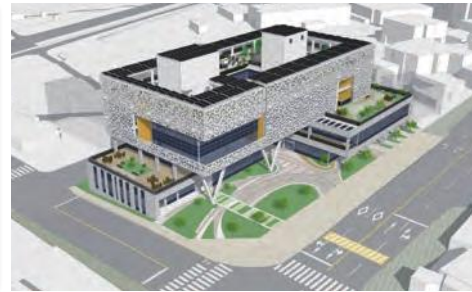
· 청도 보건소 신축·이전 사업 조감도