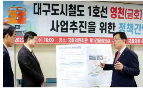
· 대구도시철도 영천(금호)연장 정책간담회 개최