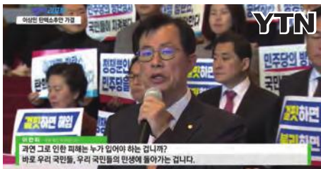
▲ 민주당의 행안부장관 탄핵 규탄