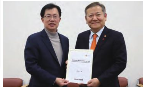
· 이상민 행안부장관과 지역 발전방안 논의