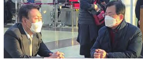
▲ 윤석열 대선후보 수행