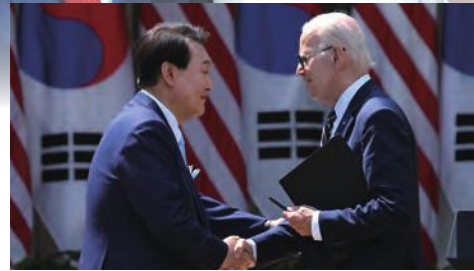
▲ 윤 대통령, 바이든 미대통령과 정상회담