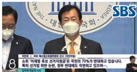
▲ 정부 예산안 심의 관련 기자회견