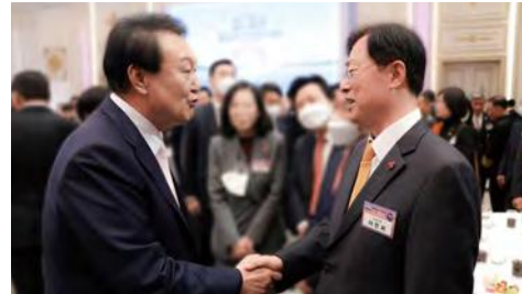
▲ 정부·여당간 적극적 정책소통 전개