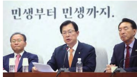
▲ 민생정치 위한 민주당 협조 촉구