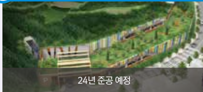
24년 준공 예정