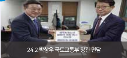
24.2 박상우 국토교통부 장관 면담