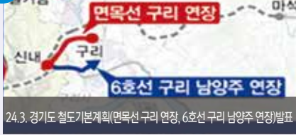
24.3. 경기도 철도기본계획(면목선 구리 연장, 6호선 구리 남양주 연장) 발표