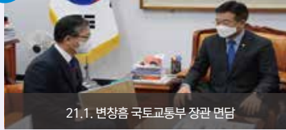
21.1. 변창흠 국토교통부 장관 면담