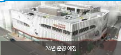
24년 준공 예정