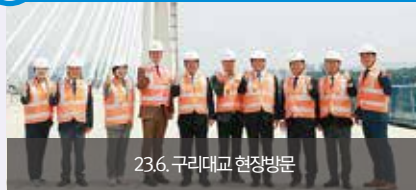
23.6. 구리대교 현장방문