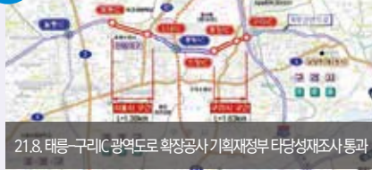
21.8. 태릉-구리IC 광역도로 확장공사 기획재정부 타당성재조사 통과