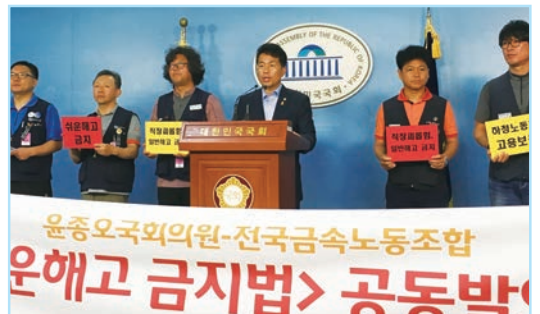
2016년 쉬운해고금지법을 1호 법안으로 발의