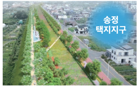
울산 북구 동해남부선 폐선 부지에 조성되는 울산숲 조감도