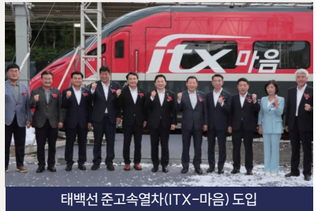
태백선 준고속열차(ITX-마음) 도입