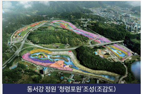
동서강 정원 '청령포원' 조성(조감도)