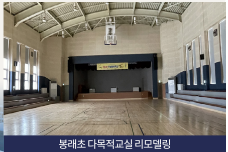
봉래초 다목적교실 리모델링