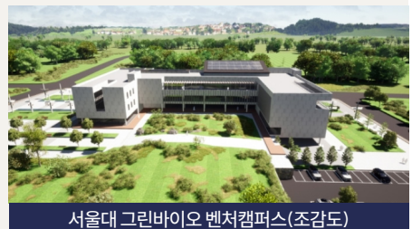
서울대 그린바이오 벤처캠퍼스(조감도)