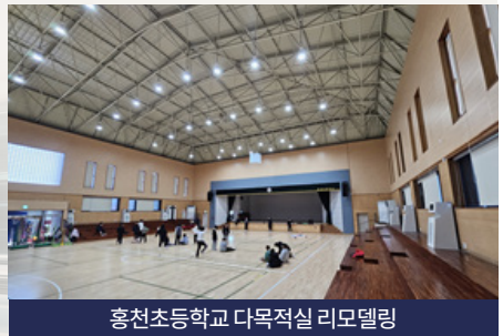
홍천초등학교 다목적실 리모델링