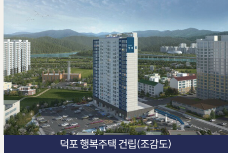
덕포 행복주택 건립(조감도)