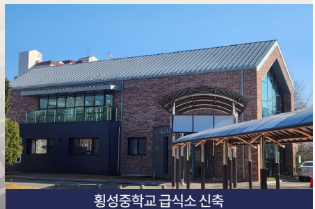
황성중학교 급식소 신축