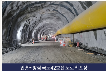
안흥~방림 국도42호선 도로 확포장