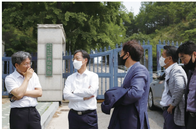
경인교대의 노후화된 환경·주차공간 개선을 위한 현장 답사 실시