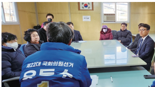
계산3동 주민들과 재건축·재개발 관련 간담회 실시