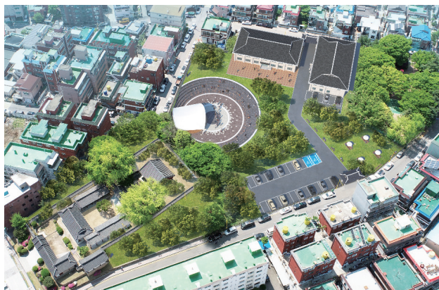
부평향교 종합 정비 조감도