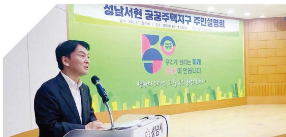
서현동 공공주택사업 주민의견 수렴하여 사업계획에 반영