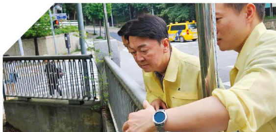
3차레에 걸친 수해대비 현장점검