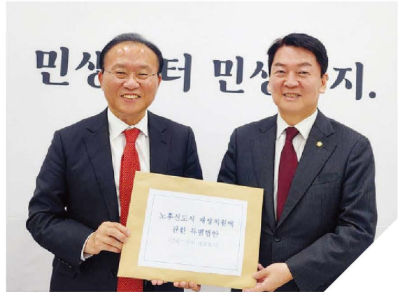
국민의힘 윤재옥 원내대표 면담

“ 2022년 5월 3일, 대통령직 인수위원장으로 ‘1기 신도시 특별법 제정’을 최우선 국정과제로 포함시켰습니다. 같은해 9월 8일, 임기 첫 법안으로 『노후계획도시 정비법』을 대표발의했고, 당 지도부 및 국토교통부 장관과 끊임없이 협의한 결과, 다음해 12월 8일 국회 본회의를 통과시켰습니다. 분당판교를 1기 신도시를 넘어 1기 미래도시로 만들 사람, 오직 안철수입니다! ”