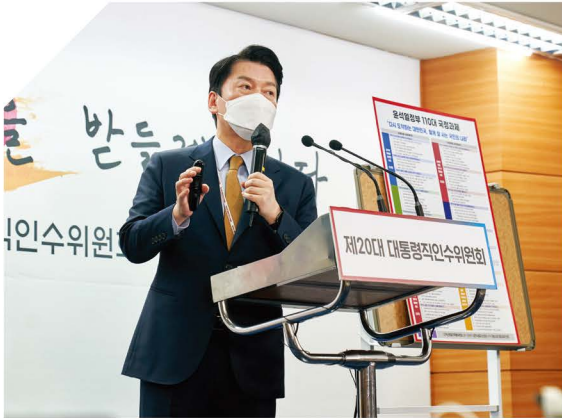
제20대 대통령직 인수위원회 국정과제 발표