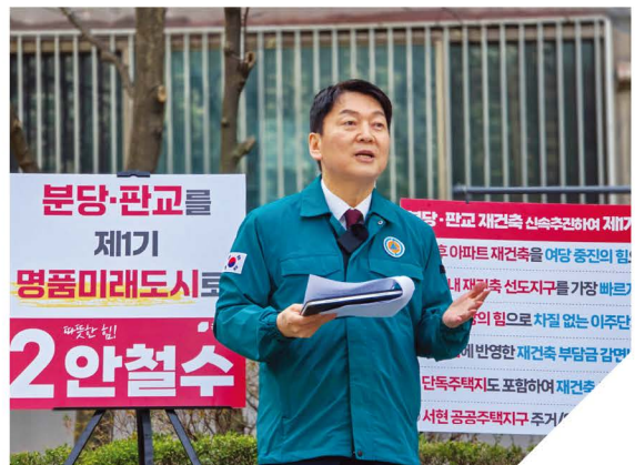
분당판교 재건축 공약발표