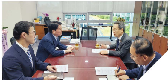
한국과학기술연구원(KIST) 판교분원 유치를 위해 이종호 과기부 장관과 면담