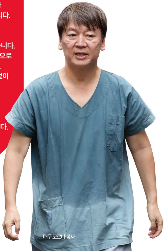
대구 코로나 봉사