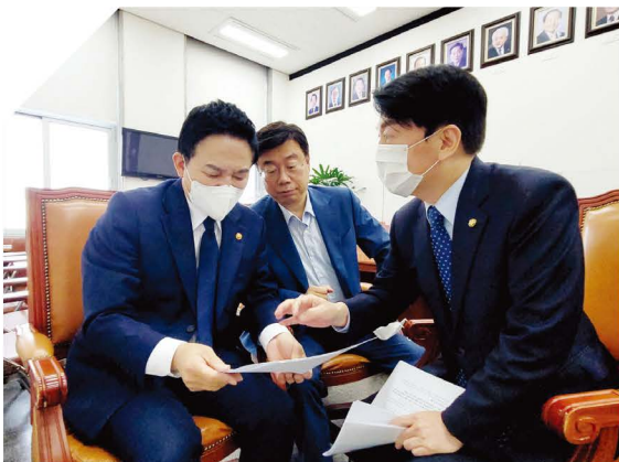
원희룡(전) 국토부장관 면담

“ 2022년 5월 3일, 대통령직 인수위원장으로 ‘1기 신도시 특별법 제정’을 최우선 국정과제로 포함시켰습니다. 같은해 9월 8일, 임기 첫 법안으로 『노후계획도시 정비법』을 대표발의했고, 당 지도부 및 국토교통부 장관과 끊임없이 협의한 결과, 다음해 12월 8일 국회 본회의를 통과시켰습니다. 분당판교를 1기 신도시를 넘어 1기 미래도시로 만들 사람, 오직 안철수입니다! ”