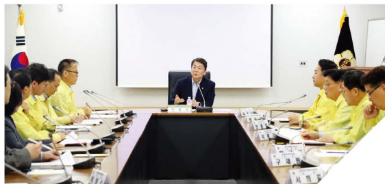
정자교 붕괴사건 이후 교량안전진단 및 후속대책 점검