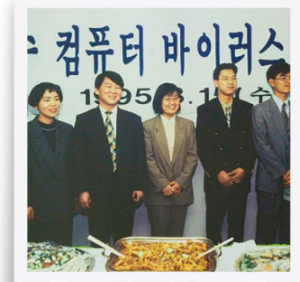
V3 백신 무료 배포