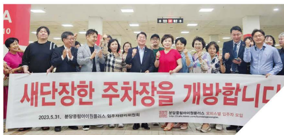
서현동 풍림아이원플러스 오피스텔 주차장을 주민 품으로