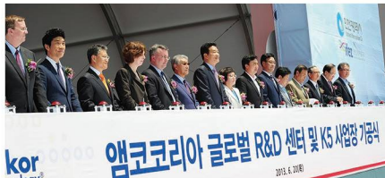
반도체기업 엠코테크놀러지 유치