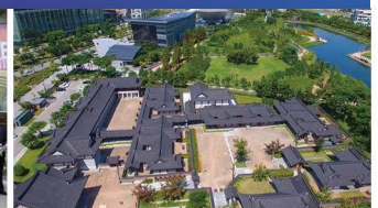
송도 한옥마을·경원재 조성