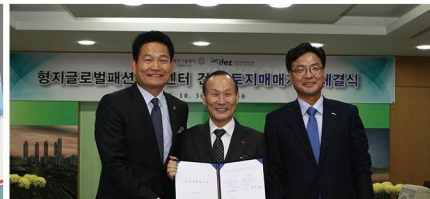
형지패션(크로커다일) 본사 유치