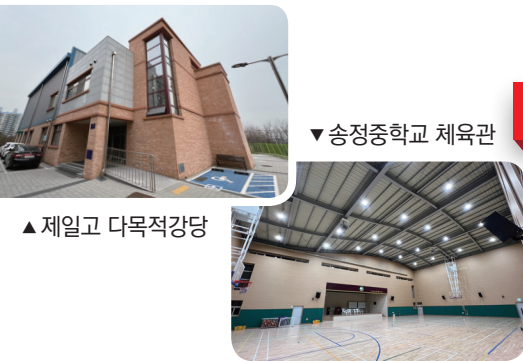
▼ 송정중학교 체육관