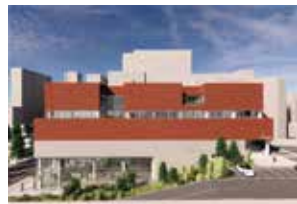
국가인권위 인권교육원 조감도 (신갈동 옛 통관물류센터 자리)