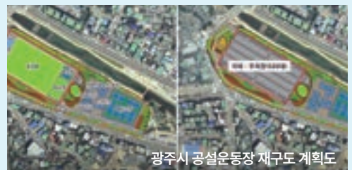
광주시 공설운동장 재구도 계획도