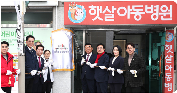
7 심야·주말·공휴일 진료 가능한 달빛어린이병원 개소!