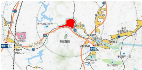
9 선바위 공공주택지구 조성 추진!