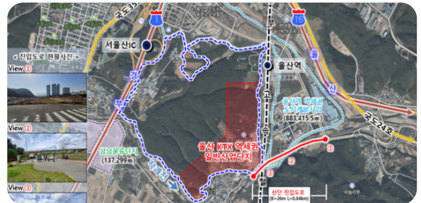
10 울산역 KTX 복합특화단지 개발사업 추진!