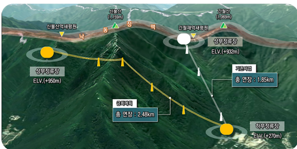
11 영남알프스 케이블카 환경부 전략환경영향평가 협의!