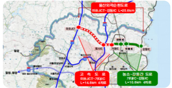
8 울산외곽순환고속도로 두동IC 신규 설치 확정!