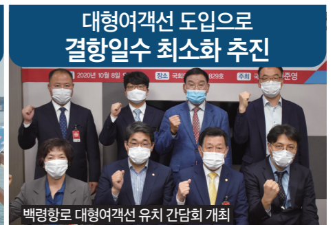
백령항로 대형여객선 유치 간담회 개최