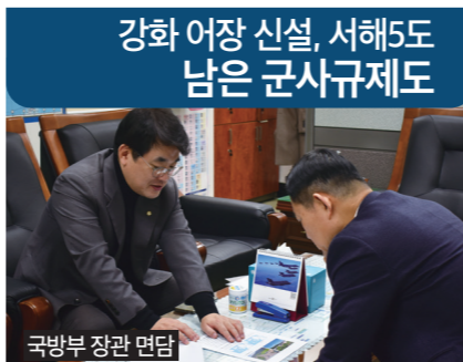
국방부 장관 면담