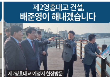
제2영흥대교 예정지 현장방문