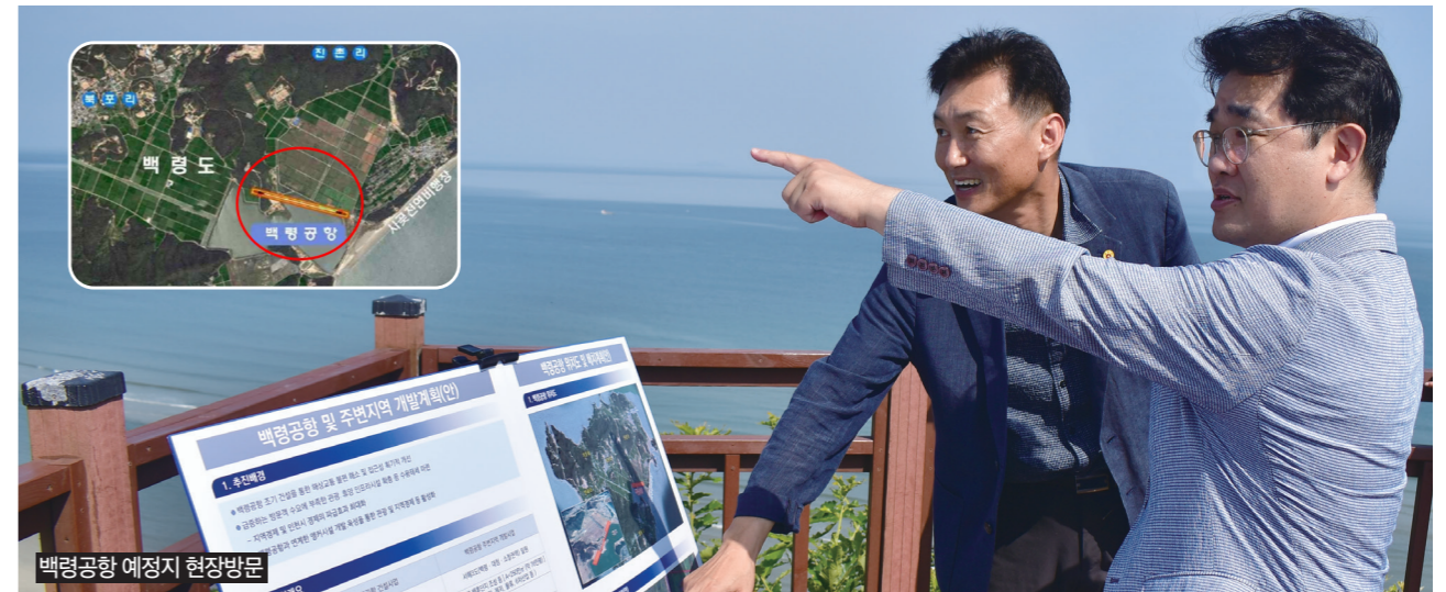
백령공항 예정지 현장방문