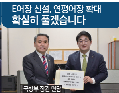
국방부 장관 면담