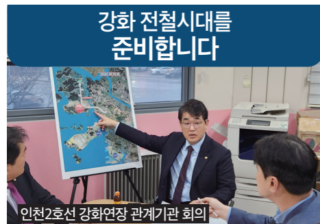
인천2호선 강화연장 관계기관 회의