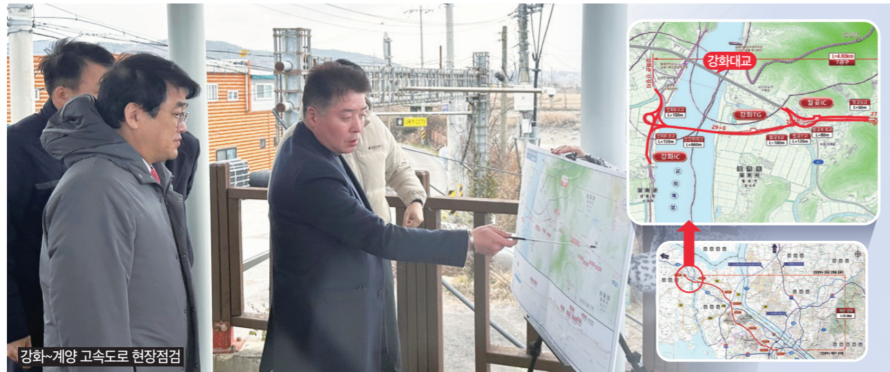
강화~계양 고속도로 현장점검