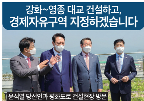
윤석열 당선인과 평화도로 건설현장 방문