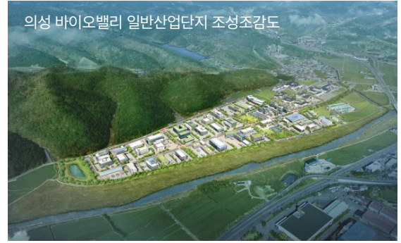
의성 바이오배터리 일반산업단지 조성조감도