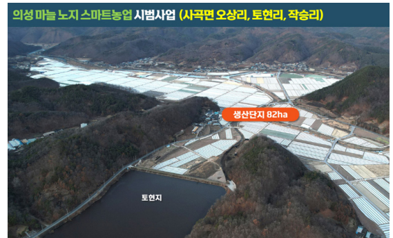
의성 마늘 노지 스마트농업 시범사업 (사곡면 오상리, 토현리, 작승리)