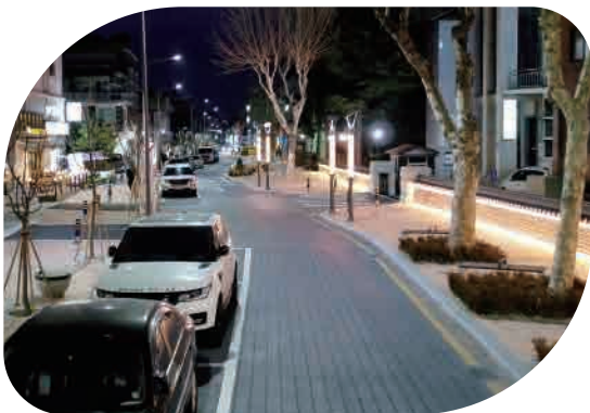
선화동 예술과 낭만의 거리 조성 옛 충남도청사 뒷길이 '문화 예술의 거리'로 탈바꿈