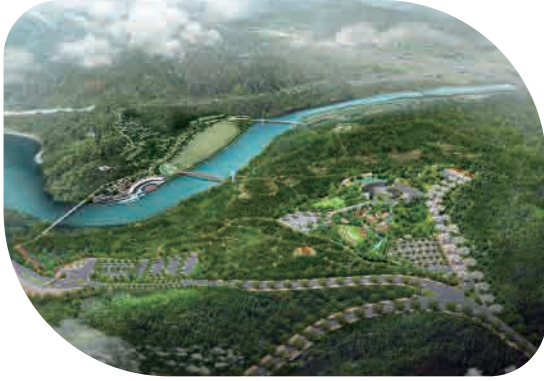
뿌리공원 2단지 조성

전국 유일의 효테마뿌리공원 2단지를 조성하겠습니다. 아직도 전국의 많은 문중에서 성씨 조형물 설치를 원하고 있습니다. 신규부지 : 198,190m 2 | 사업비 : 301억원