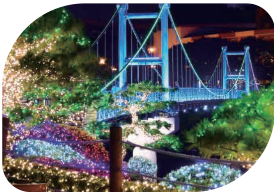
야간 경관 조명