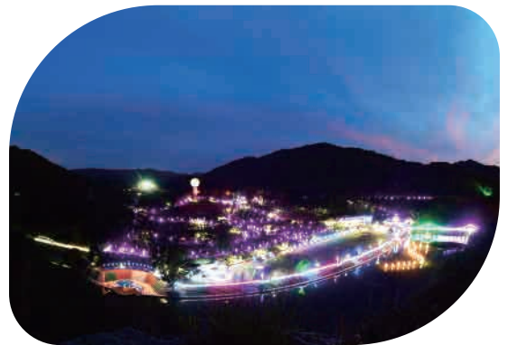
대전 효문화 뿌리 축제 야간 경관