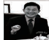
박용갑 대전 중구청장이 지방채 상환 비 훈을 통해 주요성과와 주민개요를 대외 발표하고 있다.

2017년을 마무리하는 지방에서 박용갑 대전 중구청장의 소회는 그 어느 때보다 남다르다. 올애 예 리운 재정상황 속에 전 직원의 애 리미를 결집해 광의 지방채를 전 액 상환했고, 청렴성과 투명성을 평가하는 2017 지방자치 행정대 상에서 우수기관으로 선정되는 기쁨도 만났기 때문이다. 누구도 바라지 않았던 한해는 마구 타타기 된 빛 불꽃처럼 주요 성과 와 사업 추진 과정을 돌아왔다.