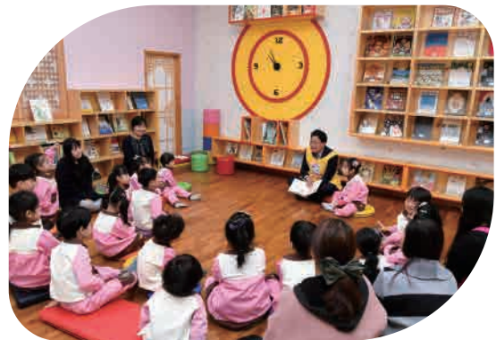
어린이 효 독서 체험관