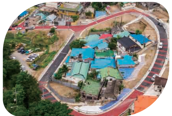
보문1.3구역 주거환경개선 사업 주민의 삶의 질 향상을 위해 노력한 시책 도로, 공원, 주차장 등 생활·교통 편의 시설 조성