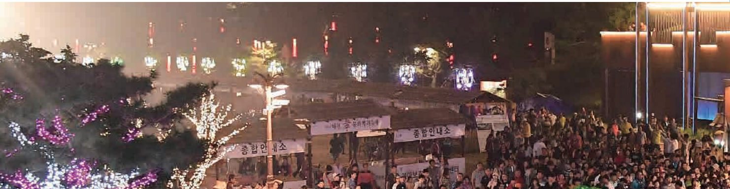
대전 효 문화 뿌리 축제