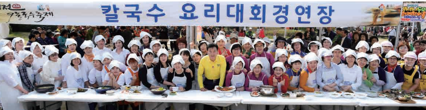
대전지역 특색 음식인 칼국수의 맛을 전국에 알렸습니다.