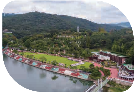
전국 유일의 효 테마 뿌리공원