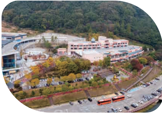
효 문화 진흥원 유치

연간 150만 명이 방문하며, 포털사이트에 대전의 가볼만한 곳으로 선정되기도 하였습니다. (2017)