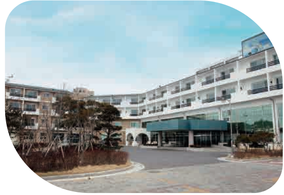
제2뿌리공원에 유스호스텔 조성