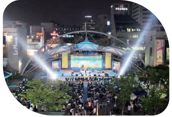
우리들공원 재창조사업 도심 속의 문화와 예술공간으로 새롭게 변화하였습니다.