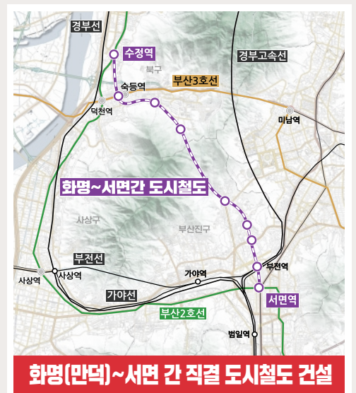
화명(만덕)~서면 간 직결 도시철도 건설