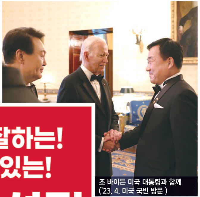
조 바이든 미국 대통령과 함께 ('23. 4. 미국 국민 방문)