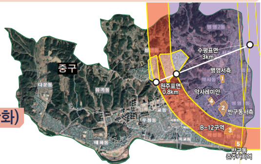
| 울산공항 고도제한 완화추진