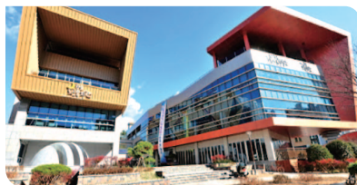
▲함월 노인복지관 건립