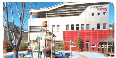
▲중구 육아종합지원센터 건립