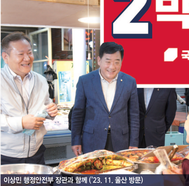
이상민 행정안전부 장관과 함께 ('23. 11. 울산 방문)