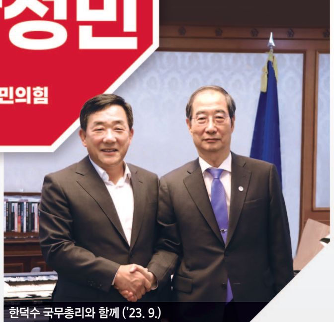
한덕수 국무총리와 함께 ('23. 9.)