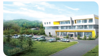
▲ 혁신도시 복합혁신센터