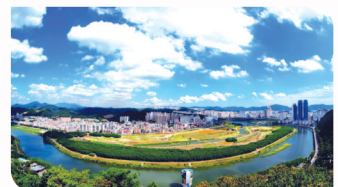
▲ 태화강 국가정원