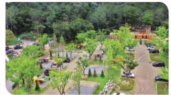
▲ 입화산 자연휴양림 조성