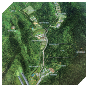
입화산 자연휴양림 예시도