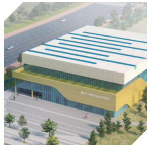
중주 다목적실내체육관 예시도 (향후 변경 가능)