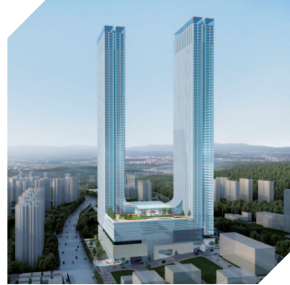
신세계 복합쇼핑몰 조감도 (향후 변경 가능)