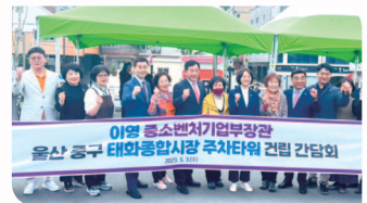
▲ 태화종합시장 주차타워 건립