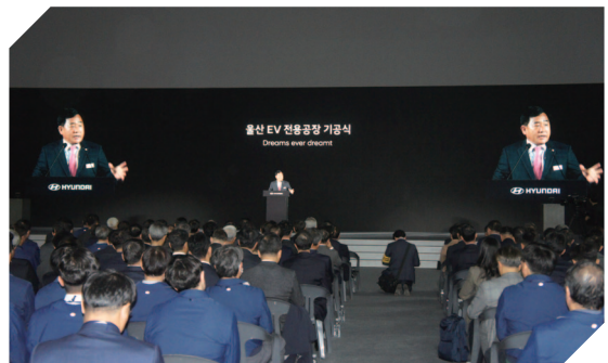
| 현대자동차(주) 울산 EV전용공장 기공식