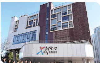
▲중구 청소년문화의집 개관