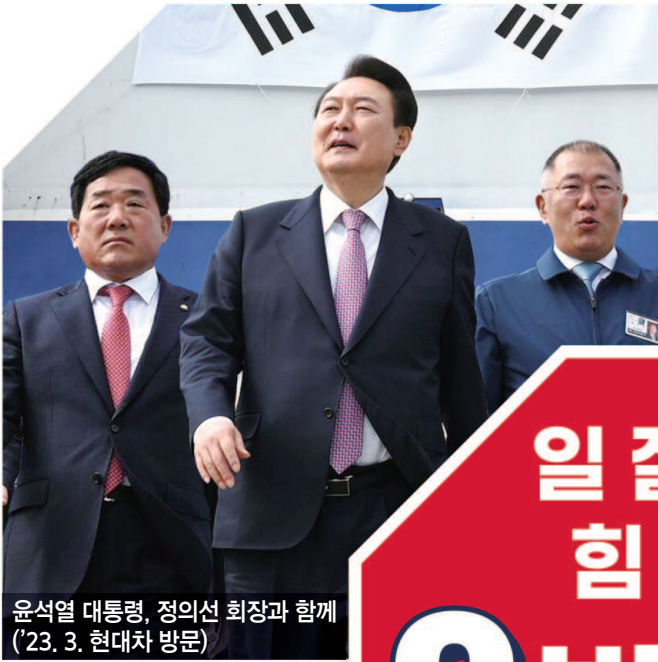
윤석열 대통령, 정의선 회장과 함께 ('23. 3. 현대차 방문)