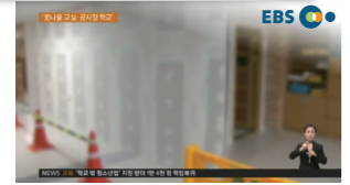
신도시 학생들.. '콩나물 교실에 공사장 학교'

한겨레 한강 철책, 언제나 다 걷힐까 한강 철책 제거 사업 5년째 중단.. 22.6km 중 4.7km만 완료