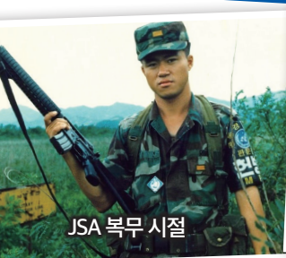
JSA 복무 시절