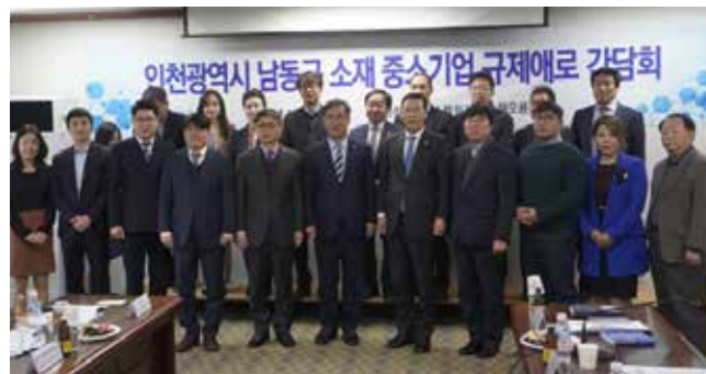
인천 경제의 중심 스마트 남동