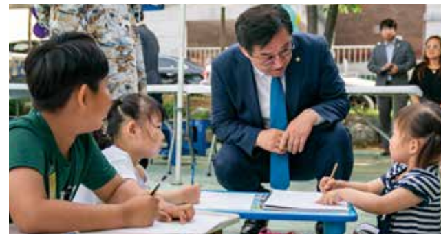
아이 키우기 좋은 도시 남동