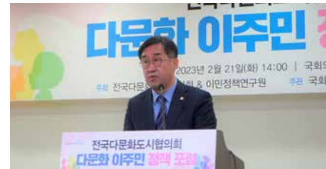
촘촘한 복지로 완성되는 남동