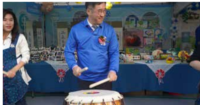
높은 문화의 힘 찾아오는 남동