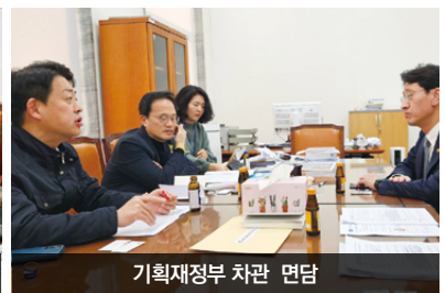
기획재정부 차관 면담