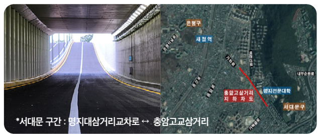
*서대문 구간 : 명지대삼거리교차로 ↔ 응암교삼거리