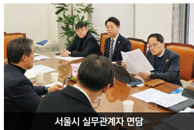
서울시 실무관계자 면담