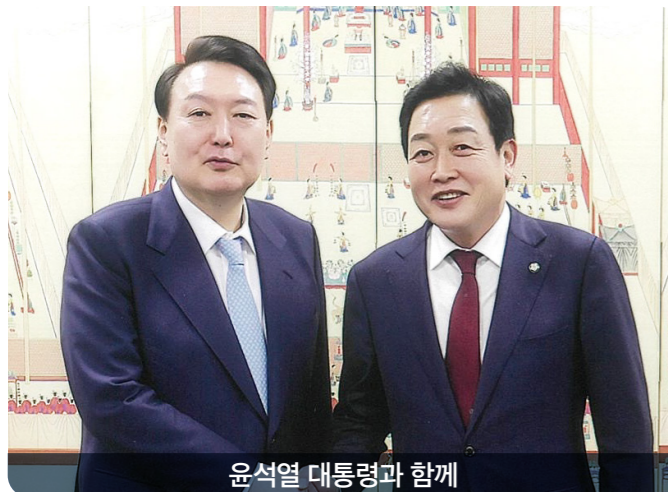
윤석열 대통령과 함께

여주·양평의 발전과 삶의 질 향상에 골고루 쓰여 시·군민 행복의 밑거름이 되었습니다.