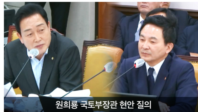
원희룡 국토부장관 현안 질의