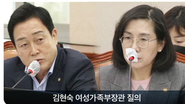
김현숙 여성가족부장관 질의