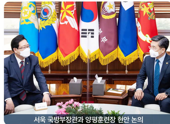
서욱 국방부장관과 양평훈련장 현안 논의