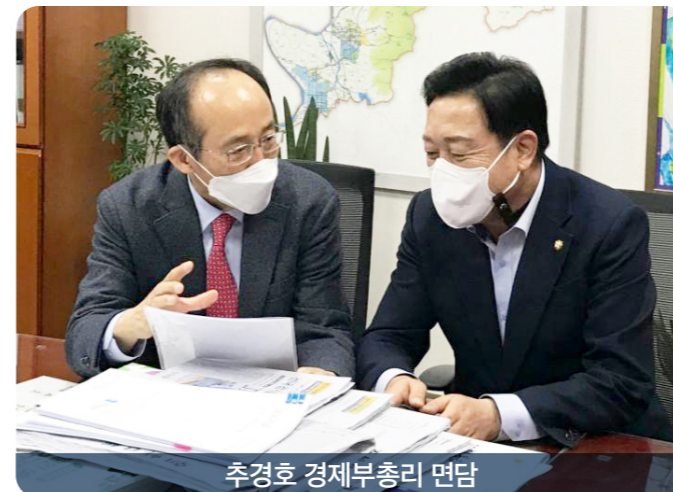
추경호 경제부총리 면담