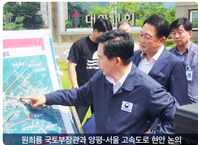
원희룡 국토부장관과 양평-서울 고속도로 현안 논의