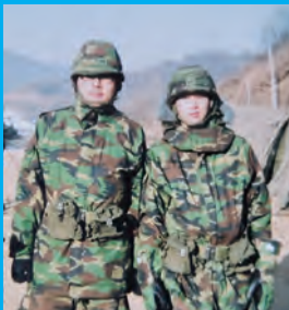
제2군단 병장 만기전역