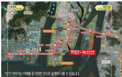
*상기 이미지는 이해를 돕기위한 것으로 실제와 다를 수 있습니다

( '24년 보상-설계-공사비 5,363억원 확보, '29년 준공 추진) 총사업비 13조 4,900억원