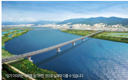
*상기 이미지는 이해를 돕기위한 것으로 실제와 다를 수 있습니다.

명지 멀티컴플렉스 스포츠센터 건립 (빙상장, 다목적코트, 챌린지 공간 등) ( '24년 설계·공사비 50억원 확보, '25년 준공 추진) 총사업비 266억원