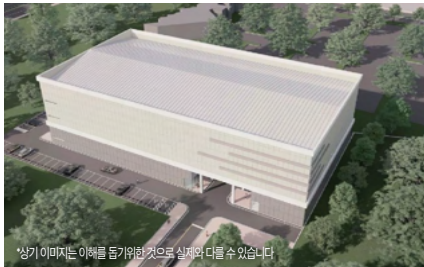
*상기 이미지는 이해를 돕기위한 것으로 실제와 다를 수 있습니다.

명지 멀티컴플렉스 스포츠센터 건립 (빙상장, 다목적코트, 챌린지 공간 등) ( '24년 설계·공사비 50억원 확보, '25년 준공 추진) 총사업비 266억원