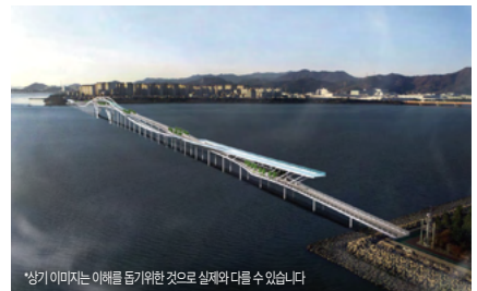
*상기 이미지는 이해를 돕기위한 것으로 실제와 다를 수 있습니다

( '24년 설계비 130억원 확보, '29년 준공 추진) 총사업비 1조 1,265억원(1,527억원 증액 추진)