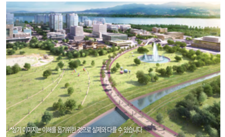
*상기 이미지는 이해를 돕기위한 것으로 실제와 다를 수 있습니다.

낙동강 횡단교량 건설 (대저대교·염곡대교·장낙대교) ( '24년 공사비 195억원 확보, '29년 준공 추진) 총사업비 8,740억원