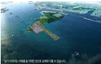
*상기 이미지는 이해를 돕기위한 것으로 실제와 다를 수 있습니다

강서의 미래를 위해 시작한 주요사업 75건, 총사업비 36조 3,500여억원 계획 중인 주요사업 34건, 총사업비 29조 8,000여억원