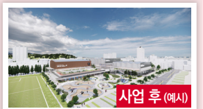
사업 후 (예시)