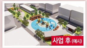
사업 후 (예시)