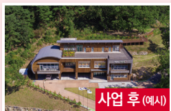
사업 후 (예시)