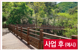
사업 후 (예시)