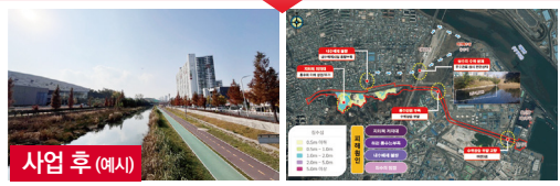
사업 후 (예시)