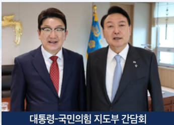
대통령-국민의힘 지도부 간담회

5년 만의 정권교체와 지방선거 승리의 주역, 헌정 사상 최초 강원 출신 집권여당 원내대표! 이제 강릉의 정치가 대한민국을 이끌어갑니다.