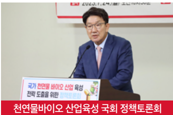
천연물바이오 산업육성 국회 정책토론회

2010년 대비 연매출 4배 이상 증가한 강릉의 산업단지. 이제 국가산단 최종 유치와 기존 산단 내실화로 더 발전한 강릉을 준비하겠습니다.