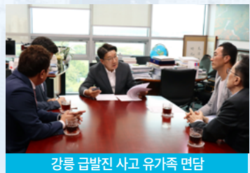
강릉 급발진 사고 유가족 면담