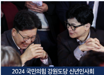
2024 국민의힘 강원도당 신년인사회