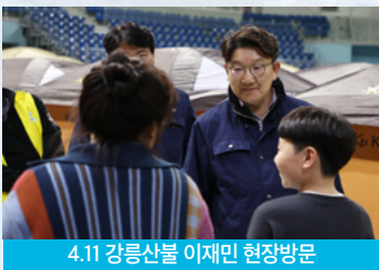
4.11 강릉산불 이재민 현장방문

4.11 강릉산불 특별재난지역 조기 선포와 피해복구, 별장 종과세 폐지, 강릉 급발진 사고 공론화 등 권성동은 강릉시민과 세심하게 동행하겠습니다.