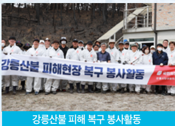
강릉산불 피해 복구 봉사활동