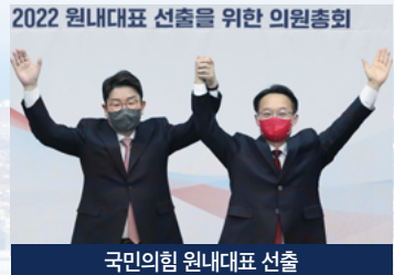
국민의힘 원내대표 선출