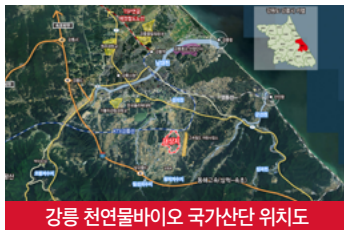
강릉 천연물바이오 국가산단 위치도