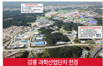
강릉 과학산업단지 전경