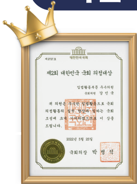
제2회 대한민국 국회 의정대상 (2022년)